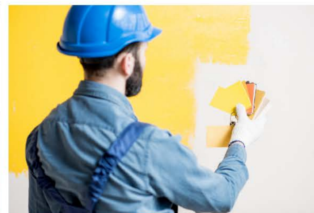
08 Полная готовность к отделке