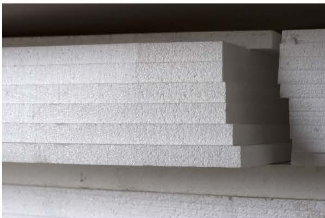
01 Удобство складирования