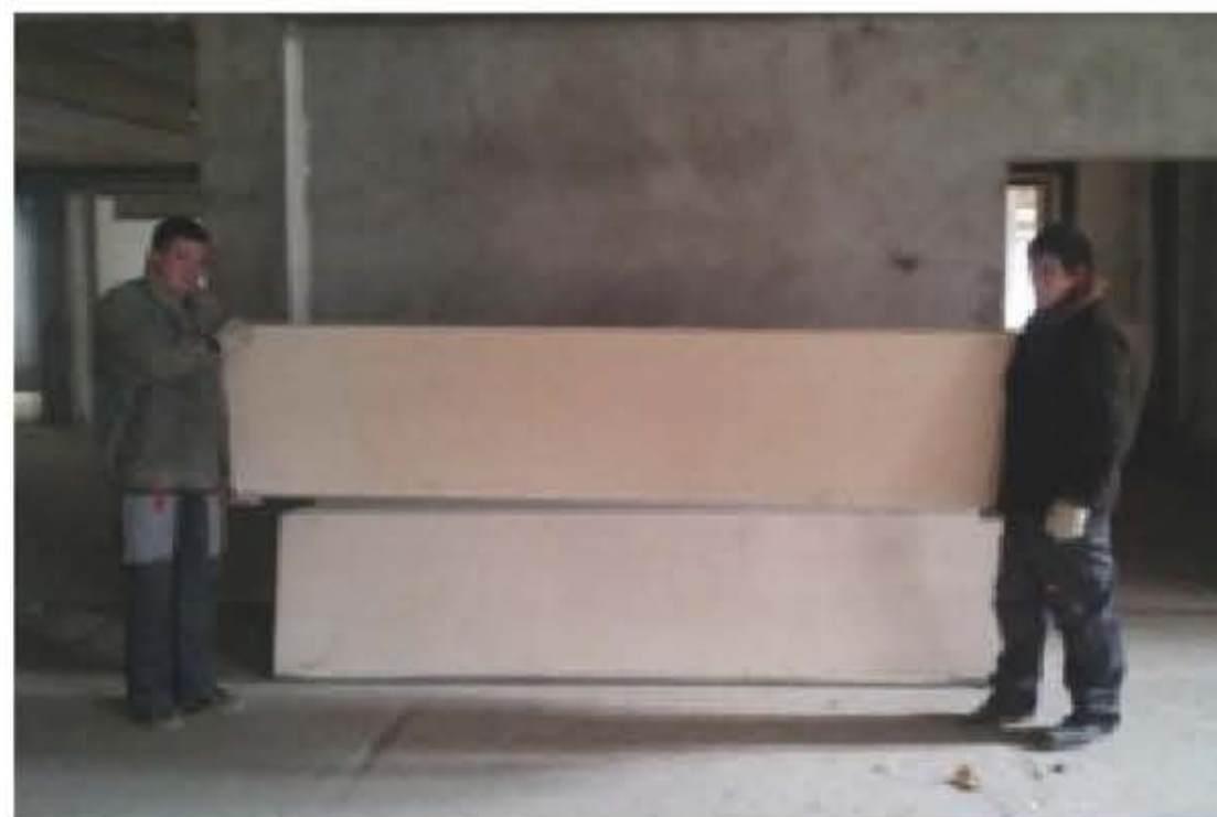
02 Малый вес