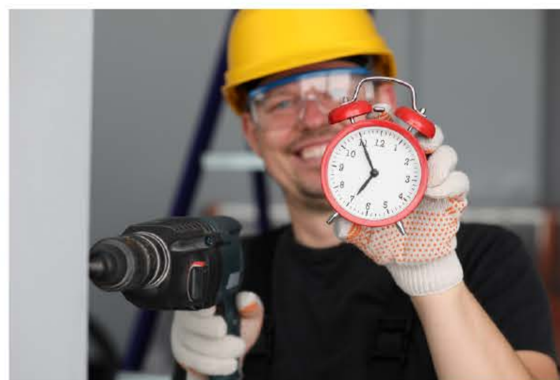
07 Высокая скорость монтажа